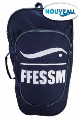
Petit sac palmes FFESSM