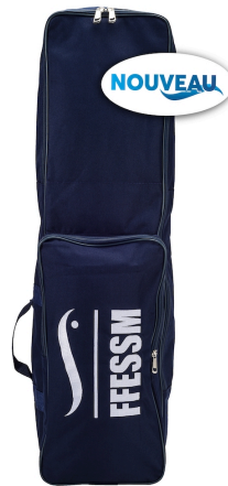
Grand sac bi-palmes FFESSM