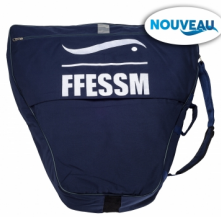
Grand Sac monopalme FFESSM